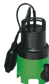
Ponorné čerpadlo 300 A