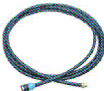
PE – sací trubka

3. Prázdná trubka bude na průrazu zdí uzavřena stěnovou průchodkou. Pro tento účel musí být z gumové narážky odstraněny předražené zápichy. Po přetažení průchodky přes PE sací trubku a kabel plovákového spínače je třeba šrouby přitáhnout tak, aby průchodka pevně přiléhala k trubce.